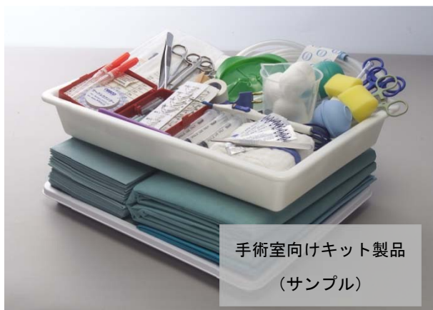
手術室向けキット製品 (サンプル)

リブドゥコーポレーションでは、今後とも市場の成長が見込まれるキット製品の安定供給と安全な製品づくりに邁進してまいります。