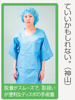
脱着がスムーズで、取扱いが便利なディスポの手術着

手術室勤務の看護師は、子供が多い人です。動きやすい環境が整っているというのは、非常に大事だと思いますね。ワークライフバランスの取れた職場だと感じます。(聞き手 陶守)