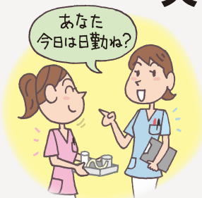
図3：勤務体系別の色分け（三重県B病院の例）

動きやすさと機能性で、すっきりパンツスタイルが定番となった看護師のユニフォーム。最近では、色のバリエーションも豊富で、ワンピース刺繍や総柄、キャラクター柄まで登場している。手入れが簡単で安価な、スクラップタイプを採用する施設も増えているようだ。着心地の良さを追求し、スポーツ用品や下着メーカーが手がけたブランドも生まれている。 調査では、A病院（愛媛県）のように、職種別に色を使い分けている運用が多く見られた。チーム医療が推進される中で、患者さんへの判りやすさを重視している。