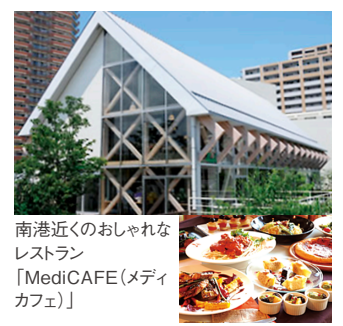
南港近くのおしゃれなレストラン「MediCAFE(メディカフェ)」

「大阪南港」といわれる大阪市住之江区咲洲地区にあるアジア太平洋トレードセンター（ATC）は、0's棟と1-TM棟とからなる大規模複合施設である。0's棟は、海が見える抜群のロケーションに約70店舗が軒を並べ、お食事やショッピングなどが楽しめる。B1階には、ワンフロア総面積約7000㎡の多目的ホール、ATCホールがある。ここを舞台に、来る10月18日「第27回日本手術看護学会年次大会」が開催される。一方の1-TM棟には、大型アウトレットモールをはじめ、家具・インテリア、ファッションなどの大型店舗やショールーム、オフィスが入居。0's棟と1-TM棟に隣接する全長450mの「0'sパーク」や2つの屋外ステージ、ATCオズ岸壁では、音楽イベントをはじめ様々なイベントが催されており、一帯が海と緑のリラックススペースとなっている。