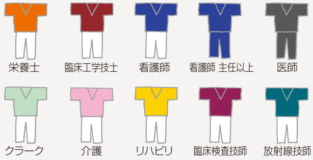
図2：職種別の色分け（愛媛県A病院の例）

動きやすさと機能性で、すっきりパンツスタイルが定番となった看護師のユニフォーム。最近では、色のバリエーションも豊富で、ワンピース刺繍や総柄、キャラクター柄まで登場している。手入れが簡単で安価な、スクラップタイプを採用する施設も増えているようだ。着心地の良さを追求し、スポーツ用品や下着メーカーが手がけたブランドも生まれている。 調査では、A病院（愛媛県）のように、職種別に色を使い分けている運用が多く見られた。チーム医療が推進される中で、患者さんへの判りやすさを重視している。