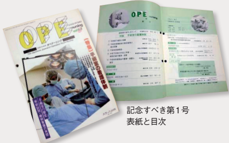
記念すべき第1号 表紙と目次

「オペナッシング」の制作に関する業務全般を担当しています。お世話になっている先生方と企画を練り、執筆の依頼をします。他にも、学会などで興味深い発表があれば直接依頼させて頂くこともあります。企画業務にはまだ携わっていませんが、今年の1月号では初めて特集ページすべての制作を担当しました。